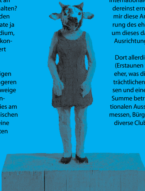
STEPHAN BALKENHOL, untitled.

Ich indes brauche weder Tabakpfeifen von ehemaligen Landeshauptleuten noch sonstigen heimatschwangeren Sperrmüll für meine Wochenendgestaltung, geschweige denn zur Identitätsstiftung meiner Person. Ich orientiere mich lieber an gegenwärtigen Themen und dies am liebsten in der Auseinandersetzung mit zeitgenössischen Kunstformen. Und dass mir um 25 Millionen Euro eine Kunsthalle mit wechselnden international kuratierten Ausstellungen in Tirol allemal lieber gewesen wäre, als ein Panoramamuseum mit holzgeschnitzten Freiheitskämpfern, versteht sich von selbst. Immerhin ist Tirol neben Burgenland das einzige österreichische Bundesland, das es noch immer nicht geschafft hat, eine