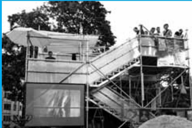
Heart of Noise Festival @stattSTUBE im Rahmen der Architekturtage 2012